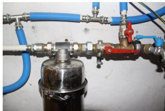
Vanne fermée (perpendiculaire au tuyau)