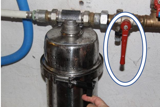
Gesloten klep (loodrecht op de leiding)