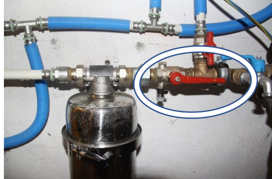
Open klep (parallel met de leiding)