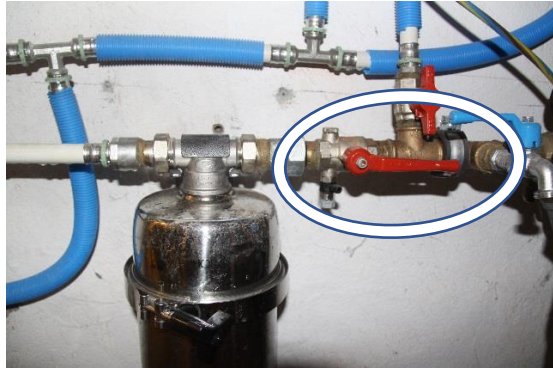
Vanne ouverte (parallèle au tuyau)