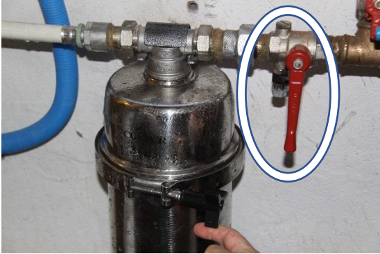
Válvula cerrada (perpendicular a la tubería)